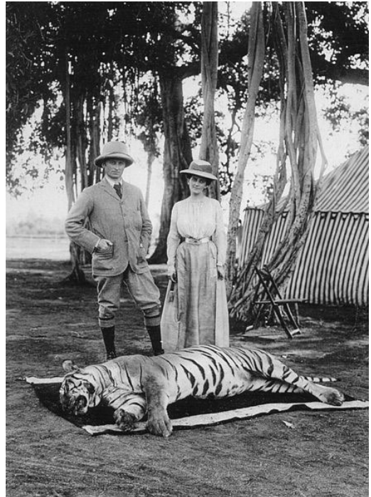
■ Kuva 1. Varakuningas Lord Curzon ja Lady Curzon vuonna 1903.

Tiikerinmetsästyksellä oli lisäksi suuri merkitys brittiläisen kolonialistisen maskuliinisuuden luomisessa 1800-luvulla. Tiikerin vaarallisuuden ja voimakkuuden takia sen metsästyksessä edusti kamppailua pelottavan luonnon kanssa ja valkoisen kolonialistin tuli oman paremmuutensa todistaakseen aina kohdata vaarat, joko luonnon pedot tai alkuperäiset asukkaat, ja päihittää heidät. Erityisesti tiikerinmetsästyksessä vaati miehisiä ominaisuuksia ja kehitti luonnetta. 55 Brittihallinnon virkamiesten, poliisien ja upseerien odotettiin suojelevan kyläasukkaita sekä karjaa verottavilta että ihmisten kimppeun hyökkääviltä tiikereiltä. 56 Britit pitivät intialaisia, sekä ruhtinaita että tavallisia ihmisiä, usein kyvyttöminä suojelemaan kyläläisiä ja ajattelivat, ettei heihin voinut luottaa tiikerintappajina. Vähintäänkin paikallisten metsästystapoja arvosteltiin, kun taas brittien omaa roolia intialaisten suojelussa villipedoilta korostettiin. 57 Tätä edisti kolonialistien yksinoikeus kantaa asetta sekä heidän