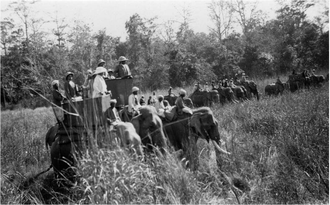
■ Kuva 4. Norsujen muodostama saartorengas.

jolle maharadža pyrki järjestämään tilaisuuden ampua tämä yksilö, tähtäsi ja laukaisi, ampuen ohi, ”katsojina neljäsataa silmäparia ja niiden joukossa satakuusikymmentä elefantinsilmää, jotka varmastikaan eivät kuuluneet tyhmimpiin.” Tiikerin kaataminen vaati vielä muutaman laukauksen. Kyseessä oli suurin sinä vuonna Nepalissa kaadettu tiikeri, ”loistokappale.” 87 Maharadža onnitteli Mannerheimia, joka ilmaisi kiitollisuutensa päästyään tappamaan näin mahtavan ja suurikokoisen tiikerin. 88 Mannerheim kuvailee leirien ja jahtien suuruutta ja hienoutta, mutta ei tunnu juurikaan pohtivan niiden järjestämiseksi vaadittua työ määrää ja järjestelyjä. Hän tuntuu lähinnä astuvan ”valmiiseen pöytään” ja nauttivan sen antimista. Palvelijat ja työntekijät, yleensäkin rahvas, pysyvät hänelle etäisinä. Asiantila ja kolonialistinen järjestys näyttäytyvät luonnollisina Mannerheimin kertomuksessa.